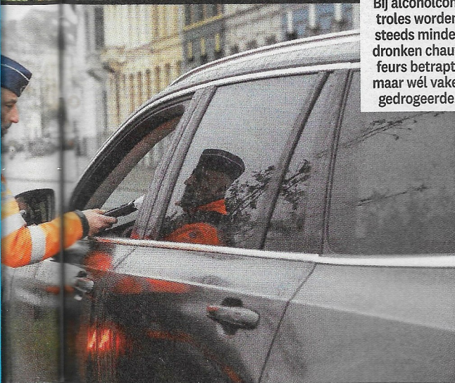
Bij alcoholcontroles worden steeds minder dronken chauffeurs betrapt, maar wél vaker gedrogeerde.