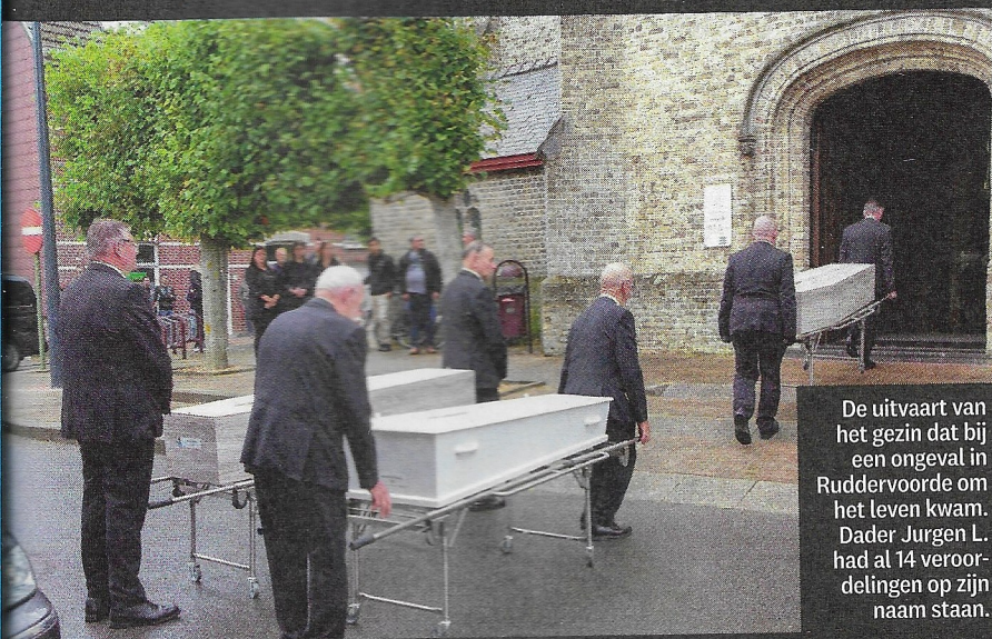
De uitvaart van het gezin dat bij een ongeval in Ruddervoorde om het leven kwam. Dader Jurgen L. had al 14 veroordelingen op zijn naam staan.

de bestuurderszetel plaatsneemt, start die auto. Dat moet volgens mij de toekomst worden. En rijbewijssloten, zodat de wagen alleen rijdt als je een geldig rijbewijs hebt.'